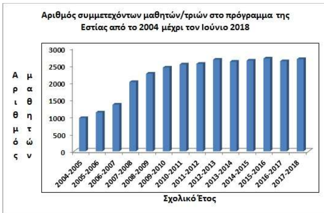
Εικόνα 2: Αριθμός των μαθητών που συμμετείχαν στο πρόγραμμα της Εστίας Γνώσης και Πολιτισμού Χαλκίδας από το σχολικό έτος 2004-05 μέχρι και το σχολικό έτος 2017-18. Είναι εμφανής η παγίωση του αριθμού των επισκεπτών, τα τελευταία έξι χρόνια, πάνω από τους 2600.