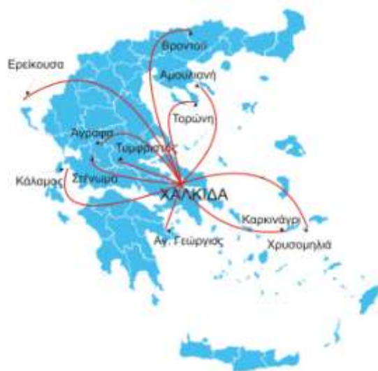
Εικόνα 4: Γεωγραφική θέση των oligothésion δημοτικών σχολείων της ηπειρωτικής και νησιωτικής χώρας που συμμετέχουν στο πρόγραμμα «ΤηλεΤαξη» της Εστίας Γνώσης Χαλκίδας

Στην εικόνα 4 απεικονίζεται η γεωγραφική θέση των σχολείων.