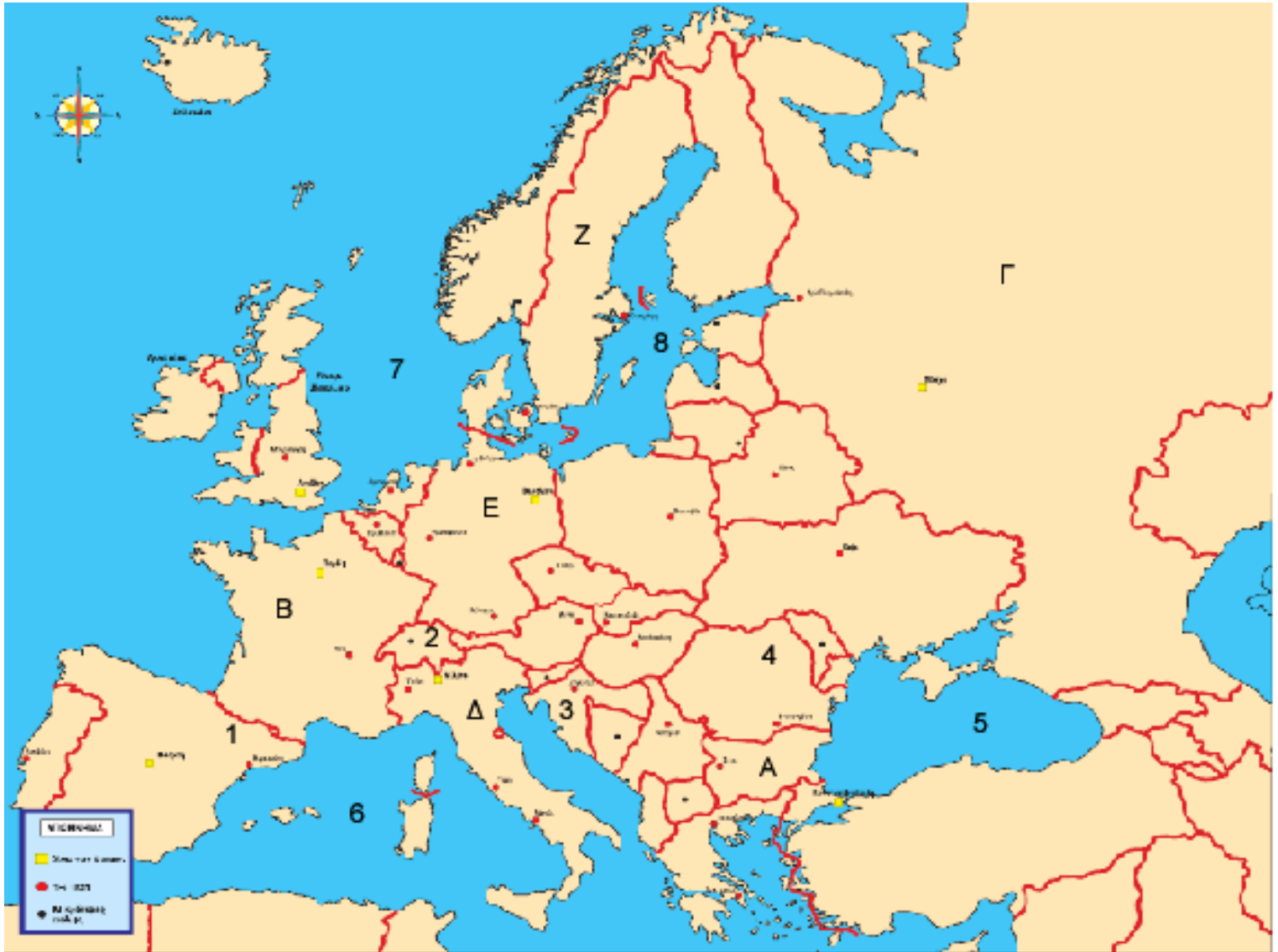
Χάρτης της Ευρώπης